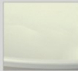
Fini extérieur lustré