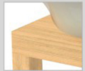
Base de bois