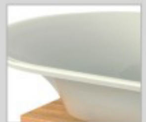
Épouse les courbes du dos