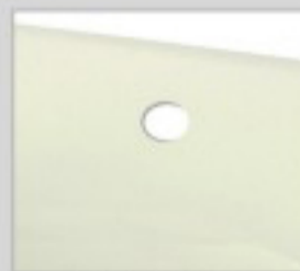
Trop plein inclus